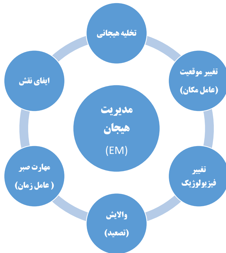
شکل-۳. مدل اکتشافی ۶ عاملی راهبردهای تنظیم و مدیریت هیجان بر طبق آیات و روایات

جهت سازندگی استفاده می‌نماید مانند ورزشکاری که تخلیه خشم خود را در انجام تمرینات سخت ورزشی بازنمایی می‌کند و به قهرمانی می‌رسد.