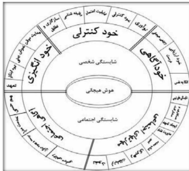
شکل-۱. ابعاد هیجان بر طبق نظریه هیجان مدار (۱۴)

۴. مدیریت هیجان و عواطف: مدیریت عواطف یعنی اداره کردن عواطف در خود و دیگران با یک موقعیت شغلی و در شرایط محیط کار، می‌توان واکنش‌های زیادی را در نظر گرفت، از جمله: انکار احساسات، فرار از مشکلات، تأیید حالت کلی موقعیت بدون تأیید جریان آن، به کارگیری عواطف جهت حل مسائل و هماهنگ ساختن عاطفه و تفکر.