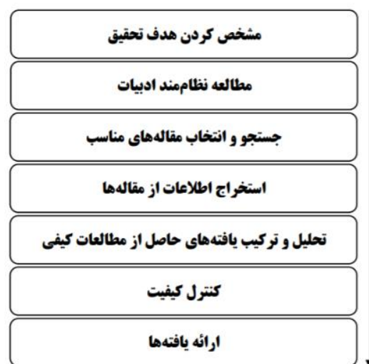
شکل-۱. مراحل و روش کلی فراترکیب (۳۸)

نوع پژوهش حاضر بر اساس هدف بنیادی، بر اساس ماهیت داده‌ها و گردآوری داده‌ها، کیفی از نوع فراترکیب است. رویکرد فراترکیب، نوعی مطالعه کیفی است که اطلاعات و یافته‌های استخراج شده از مطالعات دیگر با موضوع مشابه و مرتبط را بررسی می‌کند (۳۷). در این روش نگرشی نظام‌مند به دست می‌آید که حاصل ترکیب پژوهش‌های کیفی مختلف است و به کشف موضوعات جدید اساسی منجر می‌شود، دانش جاری پژوهشگر را ارتقاء داده و دیدی جامع و گسترده در مورد مسائل پدید می‌آورد. در این پژوهش، از روش هفت‌مرحله‌ای فراترکیب Sandelowski و Barroso استفاده شد که در شکل ۱ به تصویر کشیده شده است (۳۸). انجام مرور سیستماتیک و انتخاب مقاله‌های مناسب برای تحلیل بر اساس جستجو و یافتن مطالعات مرتبط، ارزیابی آن‌ها بر اساس معیارهای مشخص، تلفیق نتایج و ارائه یافته‌ها به‌طور موجز و شفاف کمک کرد تا تحلیل درستی در رابطه با سؤالات مرتبط با سلامت معنوی در حوزه مورد پژوهش انجام گیرد (۳۹).